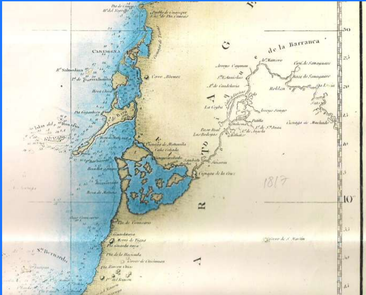
MAPA DE FIDALGO 1817: Atlas de Mapas Antiguos de Colombia de los siglos XVI al siglo XIX - Litografía Arco.