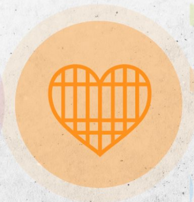
Mujeres con medida de aseguramiento preventiva intramural

Así como también se trabaja con la comunidad en general en las diferentes localidades de la ciudad, tales como: Fredonia, Faldas de la Popa, Nelson Mandela, Ciudad de Bicentenario y Olaya Herrera.