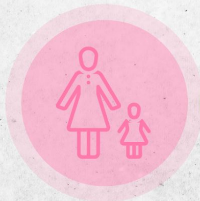
Mujeres cabeza de hogar

Con la implementación de la Ruta Integral de Emprendimiento se ha logrado trabajar varios enfoques donde se ha impactado a la población vulnerable: