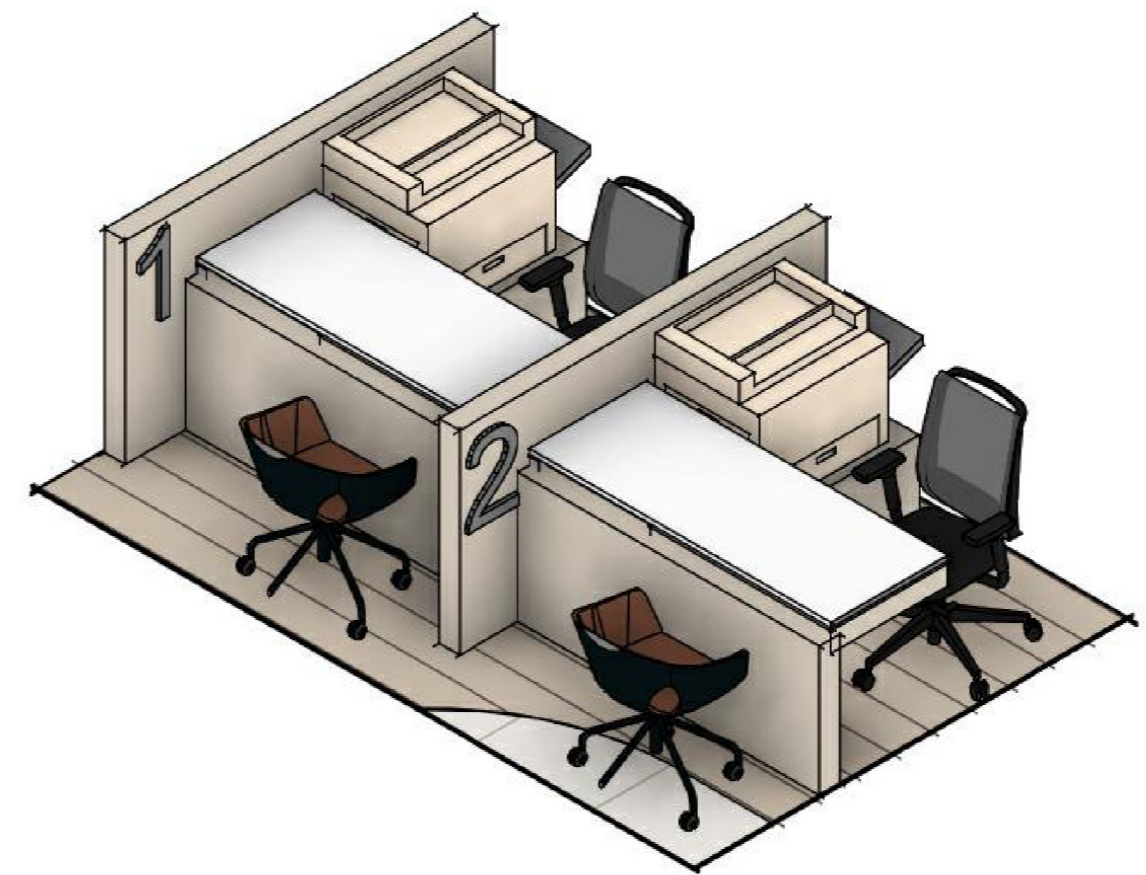
Carpinteria Especial P1 - Llamada 1 Escala 1 : 25